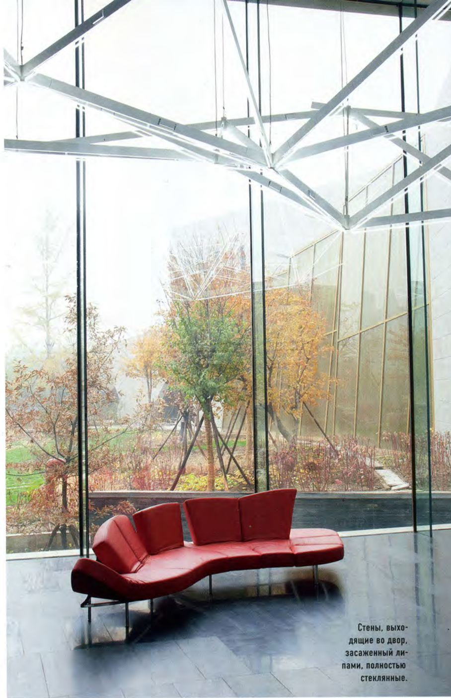
Стены, выходящие во двор, засаженный липами, полностью стеклянные.

Но самое интересное решение было придумано для многоэтажного корпуса. Две его стены, выходящие на улицу, покрыты все той же решеткой жалюзи, зато со стороны двора стена задрапирована золотистым занавесом. Множество стеклянных панелей соединены между собой и прикреплены к стальному >