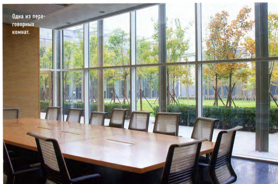
Одна из переговорных комнат.